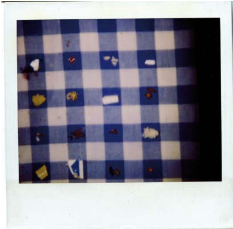
Mantel con restos de una cena ordenados (1994).