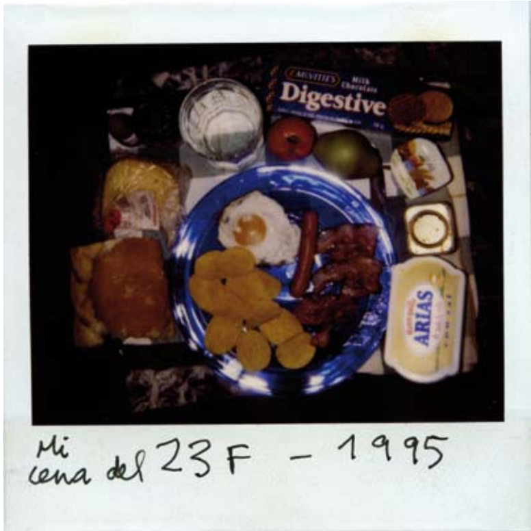
Mi cena solitaria del 23 de febrero de 1995.