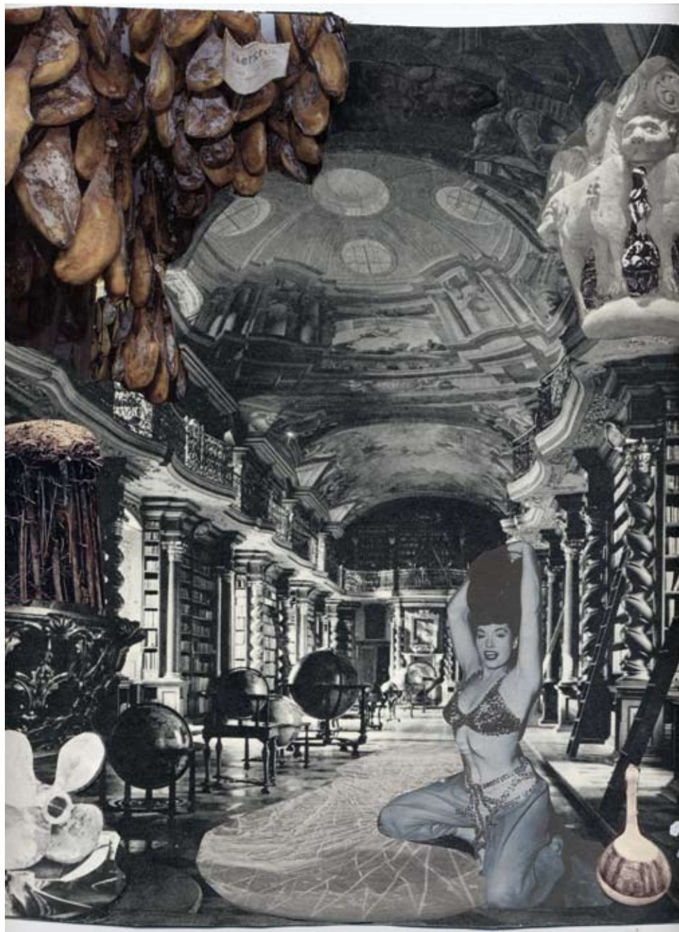
Collage de la serie Interiores. Pablo Milicua. 2011 27x22cm