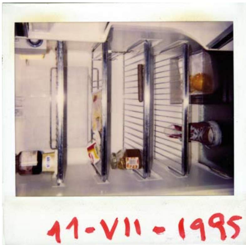
El interior de mi nevera el 11 de julio de 1995.