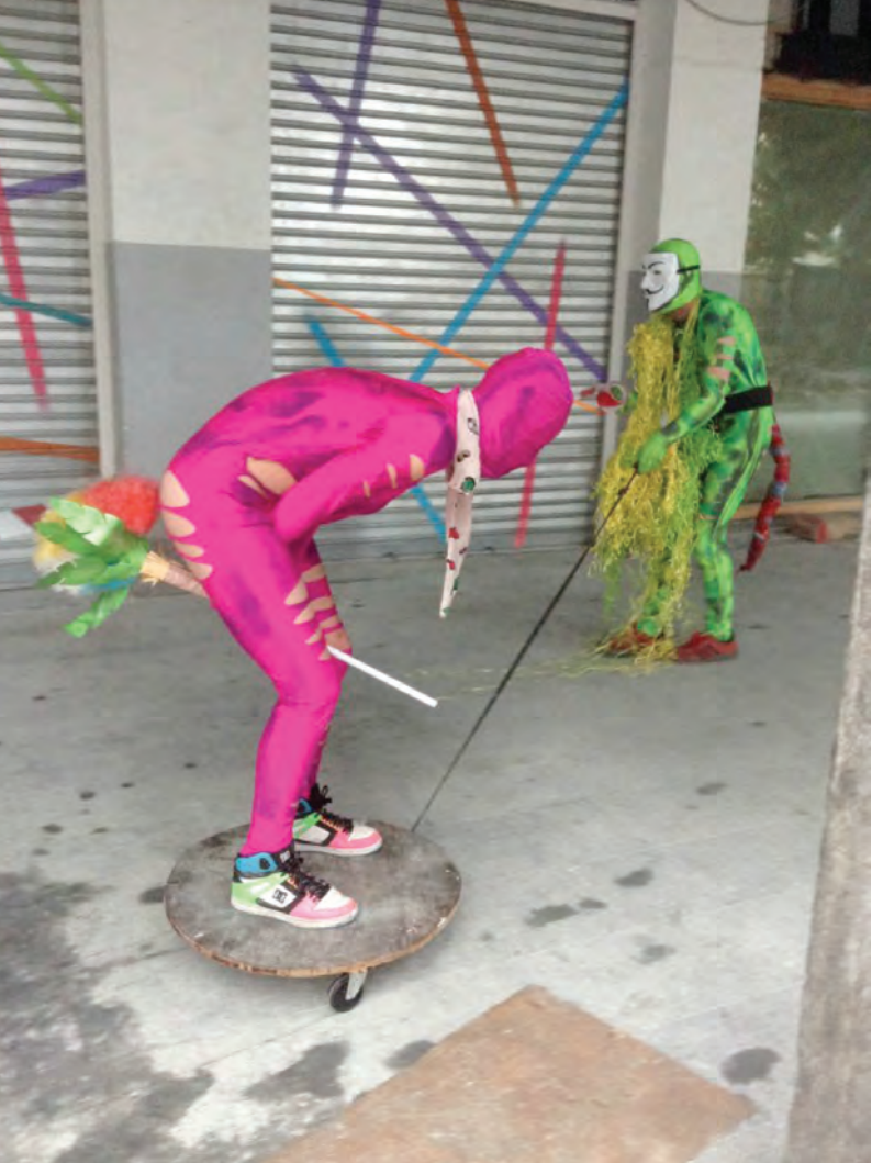
Extraterrestrial Contact, Wild Torus/Diverse Universe, Bilbao, 2015