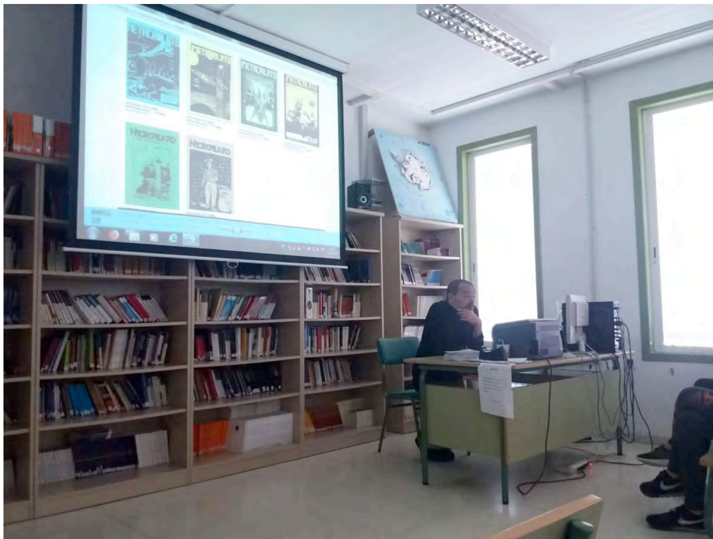
Conferencia. "De Memoria. Arte Tecnológico, performativo y underground en el País Vasco desde los años 80 hasta la actualidad."