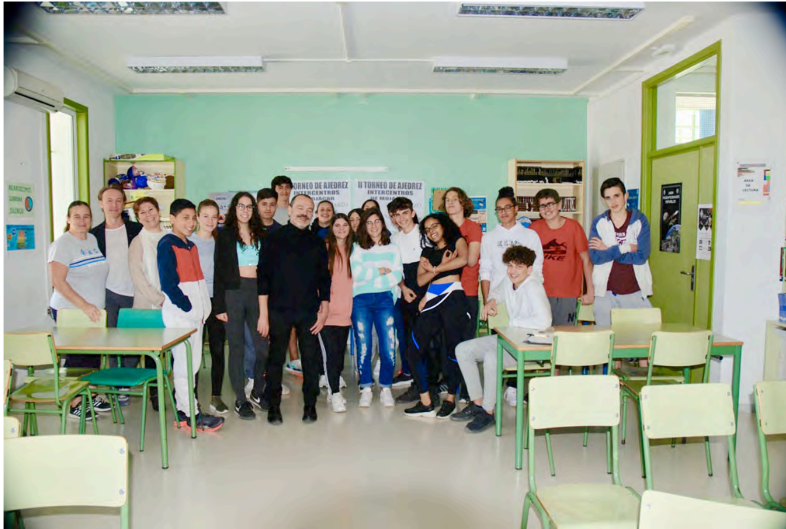
Encuentro con los estudiantes del Instituto de Mojacar.